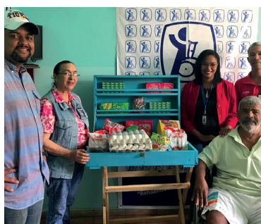
Filial Monte Cristi dona paletteras