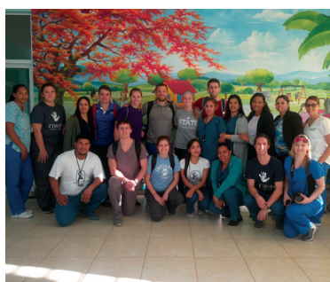
Indiana State University visita ADR Mao