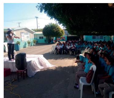
ADR Mao crea vínculo solidario con instituciones y organizaciones