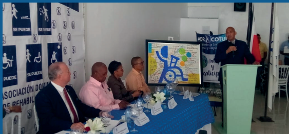
Asamblea ADR Cotuí