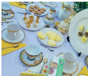
Sánchez organizó "Tarde de Té y Sombreros".