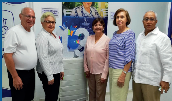
13 Aniversario Filial Salcedo