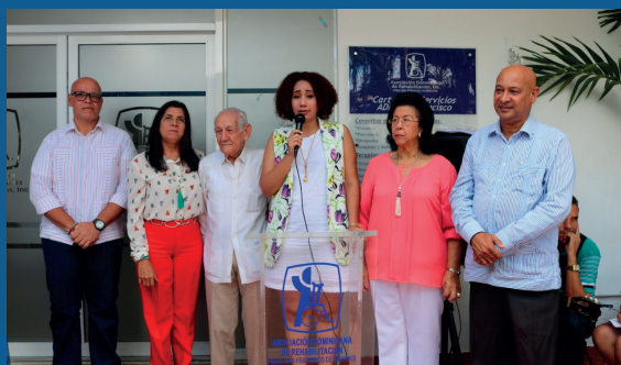
2do. Aniversario Centro Nordeste