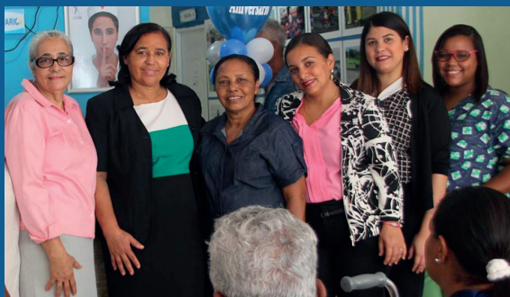
21 Aniversario Filial Sánchez