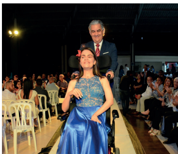
ADR San Francisco realiza 2da. "Pasarela Inclusiva".

La Asociación Dominicana de Rehabilitación, a través de las Filiales Cotuí, Sánchez, Salcedo y San Francisco, fue beneficiada con la donación de un terreno, cascos de protección, aditamentos ortopédicos, sillas de ruedas, efectos para Rayos X, entre otros aportes.