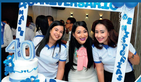
40 Aniversario Filial San Francisco