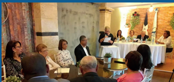
Asamblea ADR Salcedo