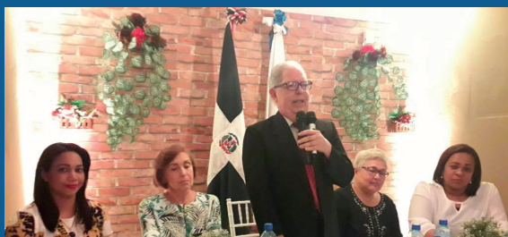
Asamblea ADR Salcedo